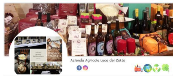
Azienda Agricola Luca del Zotto