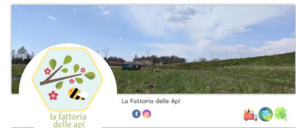
La Fattoria delle Api