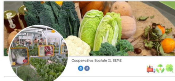
Cooperativa Sociale IL SEME